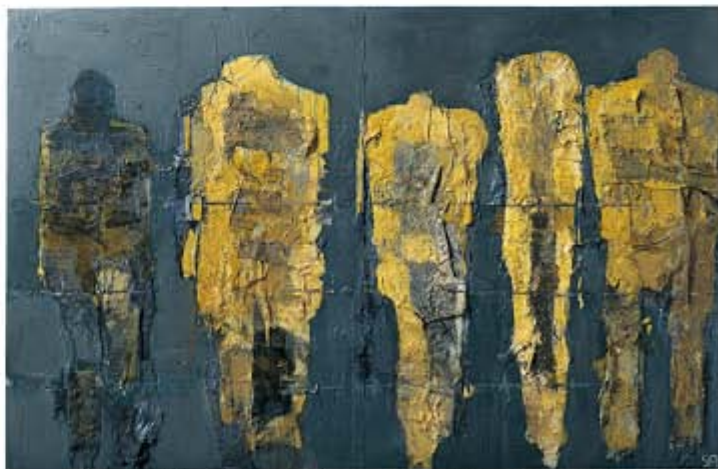
宮崎 進《楳》1988年 ミクストメディア・板 140.5×225.0(cm) 南南市美術館蔵

米子市立山陰歴史館、米子市立図書館、米子市文化ホール、米子市公会堂、 米子市淀江文化センター、米子市児童文化センター、米子市観光案内所(JR米子駅構内)、 米子高島屋、アルテプラザ(米子天満屋4階)、本の学校今井ブックセンター、今井書店駅前店、 今井書店境港店、鳥取県立博物館、倉吉博物館、安来市観光交流プラザ、 鳥取県立美術館ミュージアムショップ